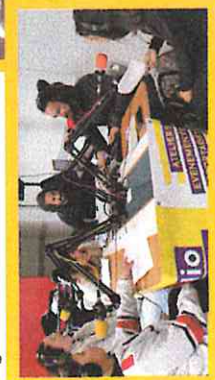
La MDA et Média Van lors des animations proposées par la Coordo.