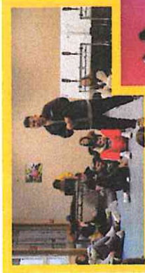
Be Ur Self - Eighteen crew

La richesse et le maillage de cette coordination permet de proposer des temps de rencontre festifs et culturels, comme le carnaval, le pique-nique des voisins et le festival des éclatés.