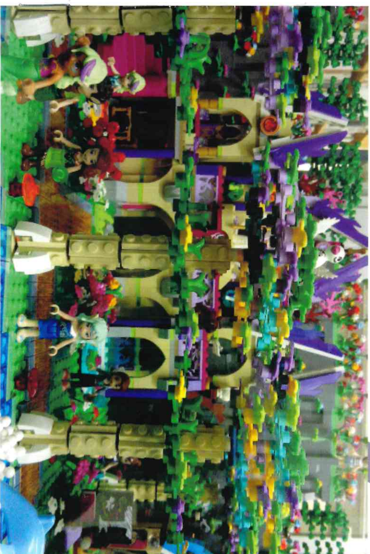
Les mondes Lego à la Bibliothèque des Gibjongs